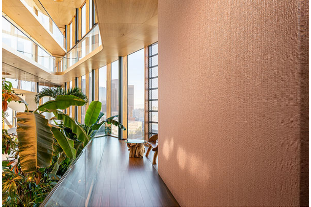
wallcovering – design Barkley

Barkley , con il suo aspetto invecchiato e una struttura che rimanda alla corteccia di un albero, regala ad ogni interno un'atmosfera naturale. L'ampia gamma di colori comprende 24 sfumature naturali che includono tonalità caramello, miele e rosso mattone. Con la sua particolare finitura opaca impreziosita da un leggero effetto luminoso, Barkley è la soluzione ideale per gli ambienti del settore hospitality ed healthcare.