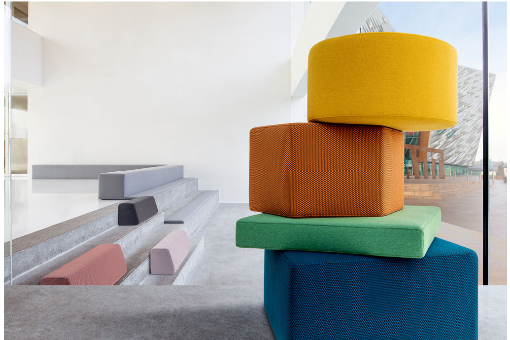
upholstery – design Acton & Rolla

Un tissu d'ameublement présentant un caractère architectural prononcé. Voici Rolla . Le dessin tridimensionnel et graphique lui confère une résistance à l'usure élevée en dépit de son relief. La gamme de couleurs de Rolla est composée de 20 teintes modernes. Des teintes de gris neutre au bleu, en passant par le rose et l'orange. Les couleurs d'Acton et Rolla sont assorties et peuvent donc parfaitement être combinées. Y compris sur le même meuble. Tout comme Acton, Rolla est ignifuge, inusable (50.000 tours Martindale, 100.000 doubles tours Wyzenbeek), inaltérable et indécolorable.