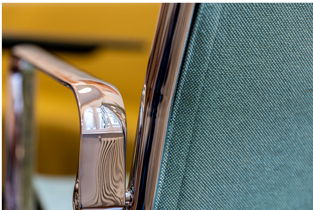
upholstery – design Acton

Acton est un tissu d'ameublement de base très résistant. Ce mélange multicolore au toucher agréable offre un caractère ludique. Il présente un aspect mat, sec et est disponible en pas moins de 39 coloris modernes. Outre les teintes neutres essentielles, le nuancier propose d'autres couleurs vives comme le jaune, l'orange, le rouge, le turquoise et différentes nuances de vert. Le tissu se prête facilement au capitonnage et est idéal pour habiller sièges de bureau et chaises de tables de réunion. Idéal par exemple pour un bureau paysager. Acton est ignifuge, inusable (90.000 tours Martindale, 100.000 doubles tours Wyzenbeek), inaltérable et indécouleurable. La tarification d'Acton est en outre intéressante. Bref, c'est un tissu incontournable pour le marché des bureaux.