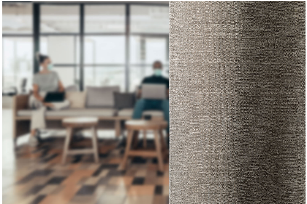
curtain – design Rona

Não estamos somente mais conscientes para as práticas de higiene, mas também para a necessidade de praticar o distanciamento social de segurança. Isto levou a um aumento de soluções de divisórias improvisadas, muito pouco humanizadas. As cortinas proporcionam uma alternativa mais natural e confortável para divisórias, e as gamas Rona e Ellis da Vescom podem ser transformadas para uma solução perfeita e económica do chão até ao teto. Contribuindo ainda mais para a sensação de conforto, as cortinas conseguem regular a entrada de luz natural num espaço e melhorar o ambiente térmico. Também sabemos que cada espaço tem as suas próprias exigências, face a isso, dispomos de opções focadas na transmissão de luz, difusão solar e 'G-value' para as todas as 5 opções.