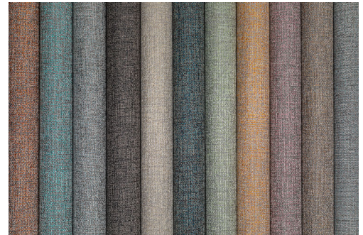
curtain – design Ellis