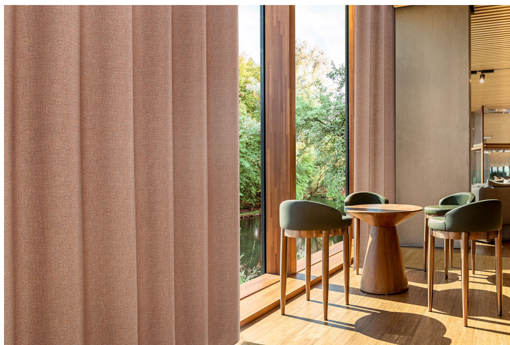
curtain – design Ellis

Os benefícios do mobiliário suave no mercado de interiores são diversos. As cortinas podem ajudar a definir o ambiente e a identidade de um espaço, conferindo-lhe delicadeza e conforto, ao mesmo tempo que regulam a luz e a temperatura. Podem atenuar a reverberação e o próprio espaço, ligando ou dividindo um espaço. Dão-nos a oportunidade de ajustar os nossos espaços para promover o nosso bem-estar.