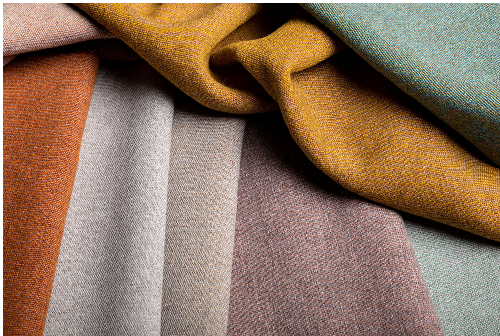
curtain – design Tula