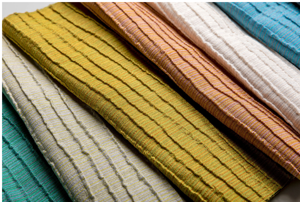
curtain – design Naltar

Naltar e Delos foram modernizadas e transformadas em tons mais coloridos, vivos e expressivos. Através de combinações inteligentes de cores e estruturas de tecidos, as misturas de fios tintos – em particular, Delos – ganham vida em três dimensões.