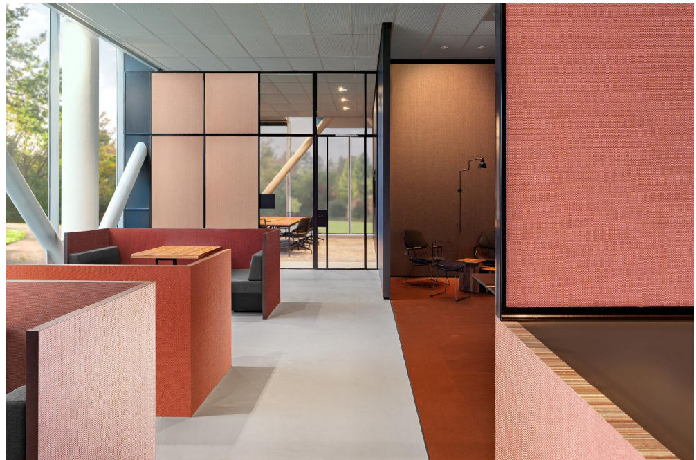
Xorel® textiel wandbekleding – dessin Meteor

Meteor vormt een perfecte basic en is een eenvoudig dessin dat is geweven van de dunne polyethyleengarens die kenmerkend zijn voor de Xorel® producten en het een unieke luxueuze glans geven. Naast de onderscheidende look, zorgen de uitstekende prestaties van Meteor en de lage impact op het milieu ervoor dat het een ongeëvenaard product is dat perfect past in deze tijd. Meteor is voorzien van het Cradle to Cradle® Silver certificaat - een garantie voor circulariteit. Het is ongelooflijk sterk, duurzaam en gaat lang mee. Daarnaast biedt het de hoogste mate van brandwerendheid in de Xorel® collectie.