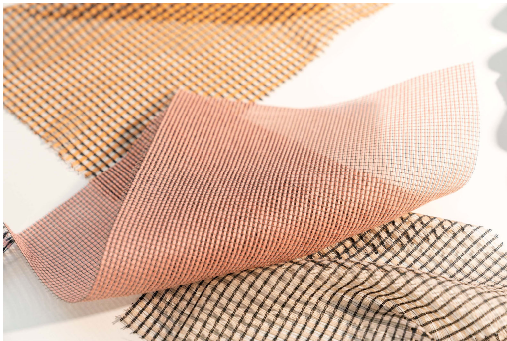
design per tende Teon & Nias