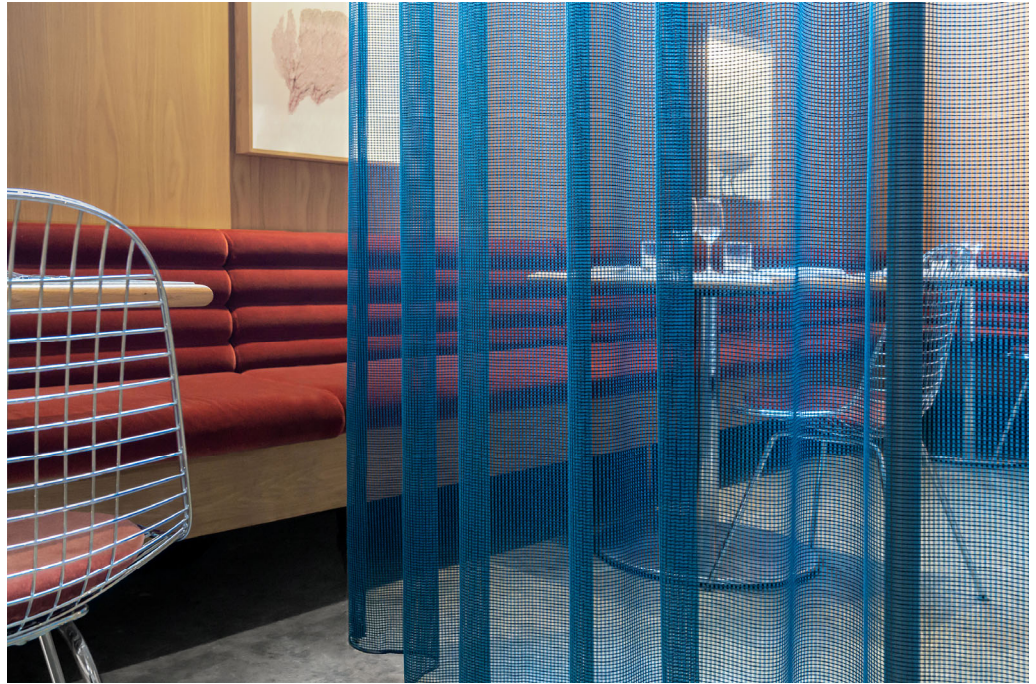
design per tende Teon