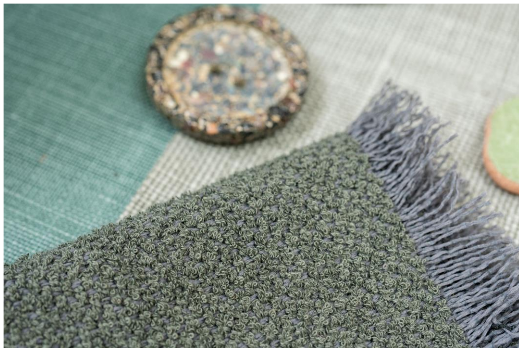
revestimento para mobiliário – Foster