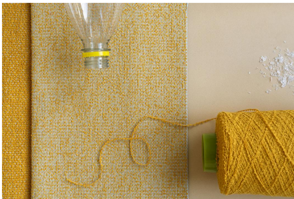
revestimentos para mobiliário – Foster e Auckland – fios bouclés reciclados

Combinando o conforto doméstico, com as elevadas especificações de desempenho exigidas pelo mercado de projetos, os tecidos bouclés reciclados e sustentáveis da Vescom, inspiram o toque físico e criam uma sensação de um casulo acolhedor em espaços comerciais. Produzidos na tecelagem da Vescom, incorporam predominantemente fio bouclé FR de poliéster reciclado, feito a partir de garrafas PET pós-consumo. Os tecidos para mobiliários com fios tingidos Auckland e Foster, alcançam uma tridimensionalidade e um toque artesanal irreplicável com fio plano não texturizado.