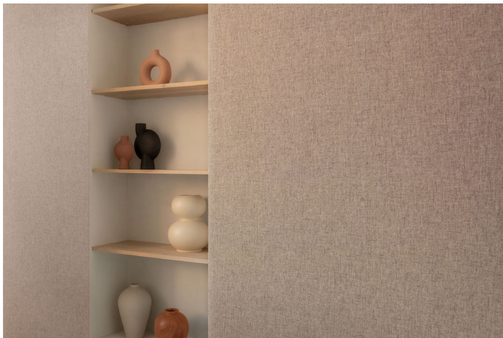
revestimento mural têxtil – padrão Dale

Recordando o ritmo gráfico das grelhas arquitetônicas, o Rila é um revestimento mural sustentável, 100% poliéster que inclui 59% de conteúdo reciclado.