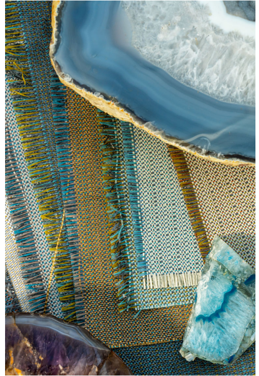
revestimento mural têxtil – padrão Jewel