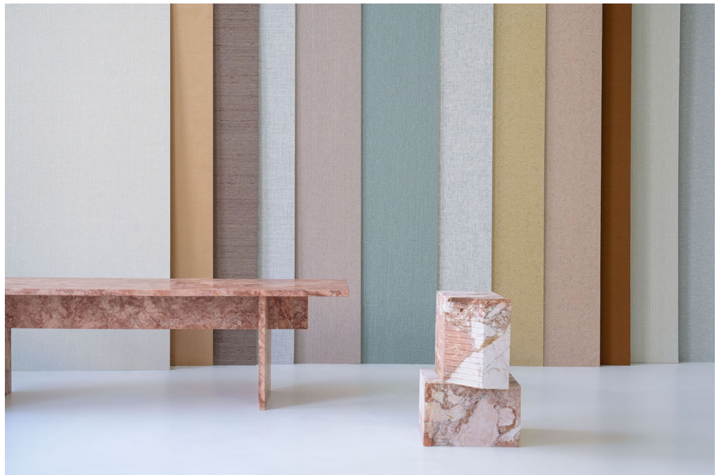
rivestimenti murali in tessuto – panoramica della collezione

La nuova collezione di rivestimenti murali tessili Vescom sottolinea differenti aspetti del significato di "luxury" nell'interior contemporaneo, con particolare attenzione ai materiali artigianali. 10 design esplorano diversi approcci nella tessitura, utilizzando materiali differenti per immagine e sensazione tattile. La collezione risponde alle proprietà intrinseche di ciascun materiale - lana riciclata, lino, poliestere riciclato, seta, pasta di legno, polietilene - dando vita a una varietà di consistenze, scale e finiture, morbide o strutturate, minimaliste o più decorative, opache o luminose.