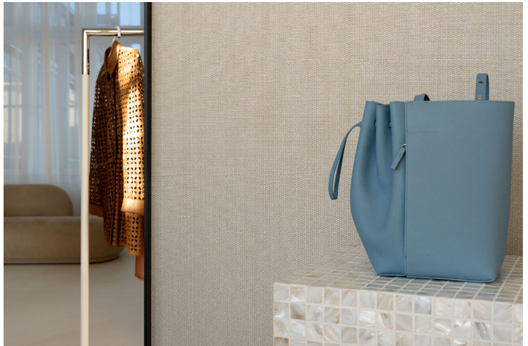
textiel wandbekleding – dessin Fraser

Het hele aanbod is perfect voor het upgraden van de hedendaagse high-end interieurs - zoals luxe hotels, restaurants, woningen en winkels - waardoor deze een rijke, tactiele uitstraling krijgen met veel karakter en comfort.