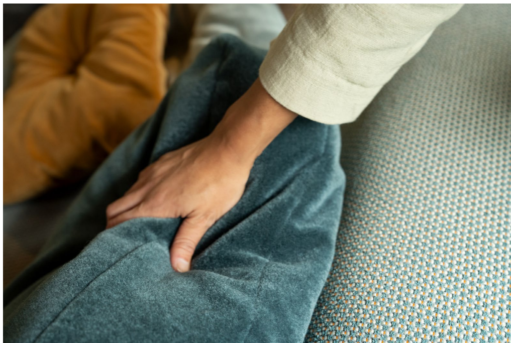
tissu d'ameublement – Monte & Moore

Produit dans l'usine de tissage écoresponsable de Vescom aux Pays-Bas, Monte est un tissu d'ameublement en velours mohair certifié Cradle to Cradle® Bronze. Fabriqué avec un poil long 100 % mohair, il contribue au confort physique et acoustique en créant de somptueuses surfaces capitonnées rembourrées dans lesquelles s'enfoncer est un plaisir. La nature traditionnelle et intemporelle du tissu d'ameublement en velours mohair est renforcée par la palette de Monte de 16 couleurs mates inspirées de la nature.