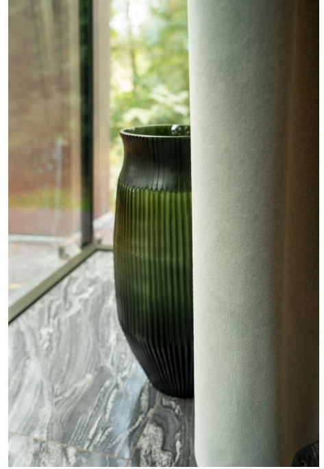
tissu d'ameublement – Moore, Monte & Ponza rideau – Ponza

Monte, Moore et Ponza s'appuient sur les connaissances approfondies de notre équipe dans le domaine des textiles et sur la riche expérience de l'entreprise en production de matériaux. À l'instar de tous les produits Vescom, ces tissus d'ameublement sont fabriqués de manière responsable, durables et répondent aux exigences les plus élevées des intérieurs de collectivités.