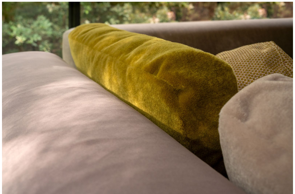
tissu d'ameublement – Ponza & Monte

L'un des tissus d'ameublement populaires de Vescom bénéficie désormais d'une palette contemporaine inspirée de la nature avec la recoloration de Ponza . Ses 33 couleurs, dont les teintes de velours classiques comme le rouge bordeaux et le vert profond, offrent la solution à tous les besoins et toutes les envies. Le tissu d'ameublement en velours FR en polyester ultra doux à poils ras a été amélioré avec une valeur Martindale plus élevée et peut désormais également être utilisé comme tissu de rideau.