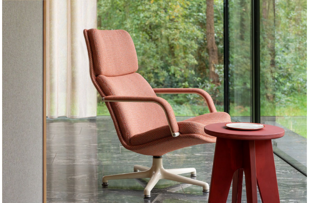
tissu d'ameublement – Moore

combinaisons de couleurs tantôt discrètes, tantôt voyantes, Moore est produit dans l'usine de tissage écoresponsable de Vescom en Allemagne.