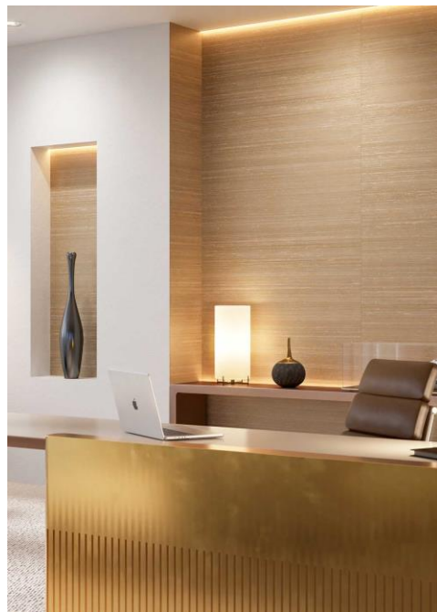
Wandbekleidung – Ilesha

Traditionell gilt die Seide als einer der luxuriösesten Stoffe der Welt. Sie hat eine sehr geschichtsträchtige Vergangenheit, passt sich jedoch perfekt an moderne Bedürfnisse an. So erzeugt das ästhetische biobasierte Material ein Gefühl von Luxus und bringt die Natur in Innenräume. Ob in First-Class-Hotels und Edelrestaurants oder exklusiven Boutiquen und Wohnräumen – Seide lässt sich harmonisch mit anderen hochwertigen und natürlichen Gestaltungsmaterialien wie Marmor oder Stein kombinieren, macht das Gesamtdesign weicher und verleiht ihm zusätzliche Eleganz und Raffinesse.