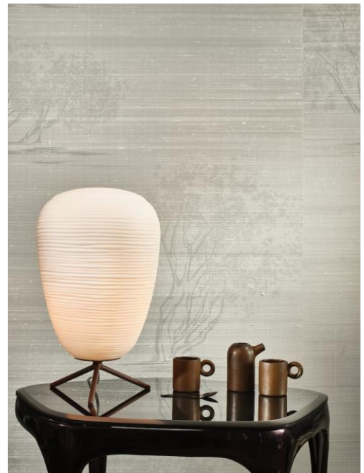
Wandbekleidung – Bodhi

Die 10 neuen Dessins verdeutlichen den vielfältigen Charakter des Materials Seide. Mit ihren gewollten Unregelmäßigkeiten und dem ausgeprägteren Knötchenmuster zelebrieren Chandra und Madhura die einzigartige Schönheit natürlicher Handwerksmaterialien. Das Dessin Ravi wiederum unterstreicht den der Seide innenwohnenden Glanz, indem es in Innenräumen mit dem Licht interagiert. Andere Dessins der Kollektion, darunter Nirmala , sind geprägt von einer sanften Mattheit. Einige der neuen Seidentapeten stellen mit aufgedruckten Motiven eine zusätzliche Verbindung zur Natur her.