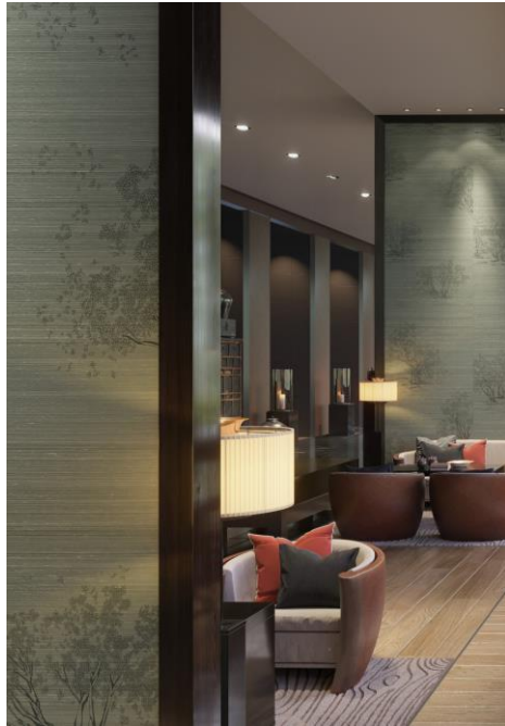
Wandbekleidung – Bodhi

So stellt Bodhi den Bodhi-Baum dar, der ein bedeutendes Symbol der Erleuchtung im Buddhismus ist. Dipti wiederum erinnert mit unregelmäßigen Linien an Gebirgszüge oder an die Erdschichten. Khilana weist ein Blütenmuster auf, das sich auf die Hindi-Bedeutung des Namens bezieht. Die verschiedenen Muster entstehen durch unterschiedliche Drucktechniken, welche das jeweilige Look-and-Feel der Dessins bestimmen und ihnen dreidimensionale oder auch metallische Effekte verleihen.