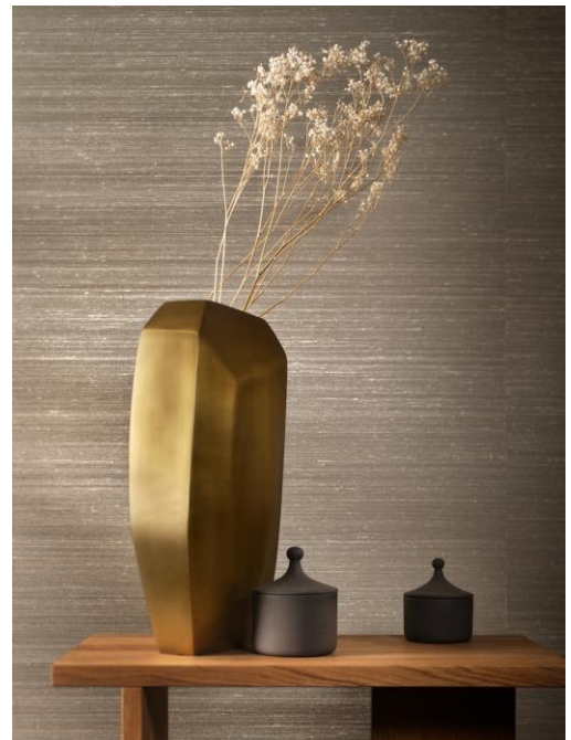
Wandbekleidung – Ilesha

Die Kollektion der gewebten Seiden-Wandbekleidung von Vescom ist facettenreich und vielfältig. Doch eines haben die Dessins gemeinsam: Jedes von ihnen spiegelt mit einer einzigartigen Struktur und mit edlen Farben die der Seide innewohnende Ästhetik wider. Obwohl industriell gefertigt und für den Objektmarkt bestimmt, kommt ihre handwerkliche Note klar zur Geltung – sei es durch feine Fadenverdickungen oder gewollte Unregelmäßigkeiten.