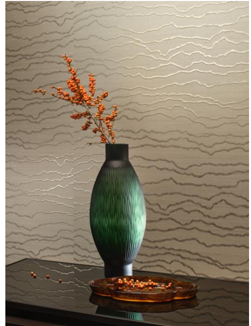
Wandbekleidung – Dipti

Eine große Farbpalette von 111 ansprechenden Farbtönen unterstreicht die Verbindung der Kollektion mit der Natur. Sie umfasst das ganze Farbspektrum von Edelmetallen wie Gold, Silber und Bronze bis hin zu sanften Pastelltönen und der erdigen Eleganz von Terra Rosa.