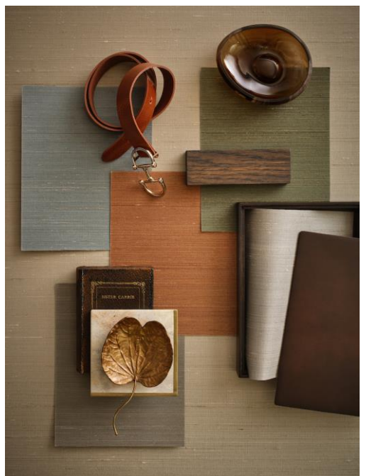
Wandbekleidung – Nirmala