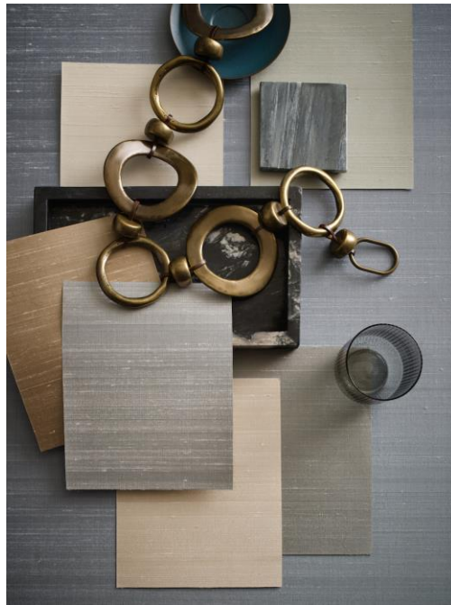
Wandbekleidung – Chandra